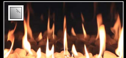
czarne lustro ceramiczne