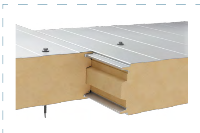
Schemat łączenia płyt